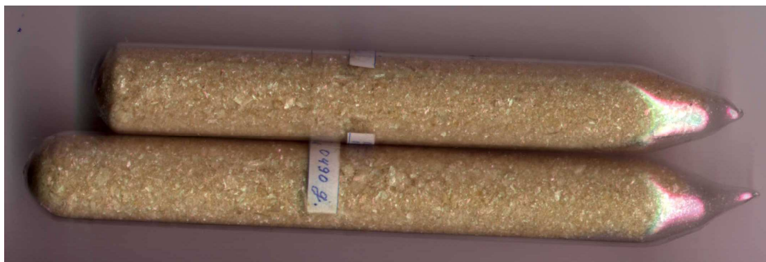
Лиофилизированный пчелинный яд.

Высушенный пчелинный яд может содержать дополнительные видимые компоненты, которые рекомендуется устранять. Пчелинный яд нужно сохранять в темных стеклянных бутылках, в темном месте и, по возможности, в холодильнике при влажности ниже 10%-ов. Дегидратированный пчелинный яд можно сохранять в холодильнике до 1 года. Окончательный продукт, после лиофилизации, рекомендуется сохранять в запечатанной эпруvette. Лиофилизированный пчелинный яд можно сохранять в холодильнике до 5 лет.