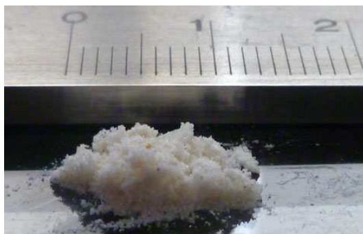
Количество пчелинного яда, соскребленного со стекла в результате однократного сбора с одного улья. Видны 2 см. шкалы.

Внимание: если программа многократно задействовала какой-либо из автоматических предохранительных механизмов, в исключительно редких случаях аппарат может не выключиться автоматически по истечении 40 минут. В подобном случае его нужно выключить вручную.