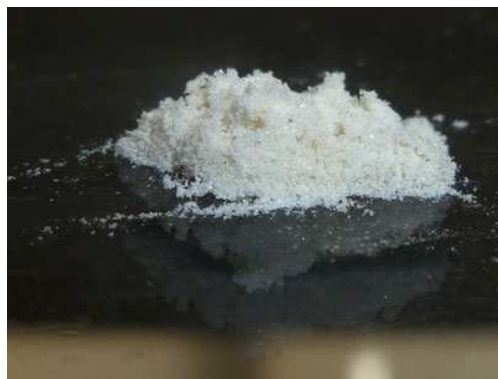
Пчелинный яд, соскребленный со стекла в результате однократного сбора в одном улье.

Внимание: если программа многократно задействовала какой-либо из автоматических предохранительных механизмов, в исключительно редких случаях аппарат может не выключиться автоматически по истечении 40 минут. В подобном случае его нужно выключить вручную.